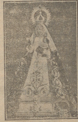
Nuestra Señora de Sonsoles

Deliciosos atractivos tienen todas las advocaciones con que saludamos a la Reina de cielos y tierra, Madre de Dios, Inmaculada; pero el de Virgen de Sonsoles , conque en esta tierra bendita más frecuentemente se la llama, tiene algo de más delicado y conmovedor que atrae con suavísima violencia las almas.