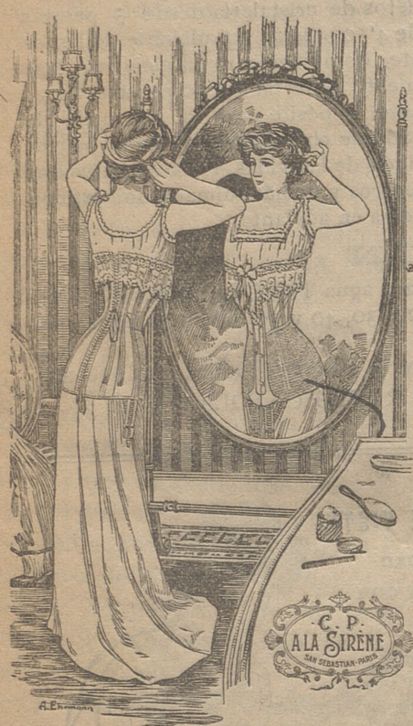
CORSÉ "ENA," Patente (Brevet) N° 27.171

Papeles pintados de todas clases. Precios sin competencia.