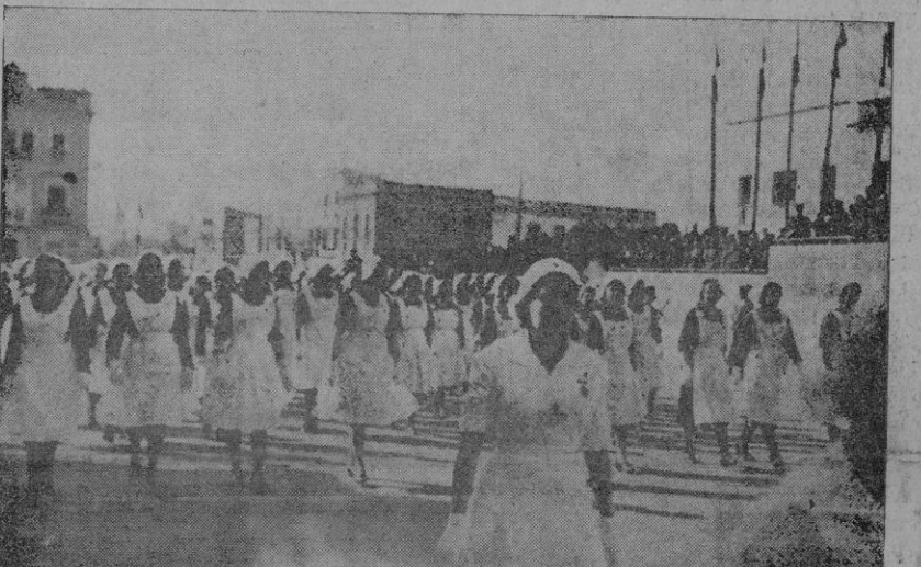
En anchas hileras, desfilaron también las muchachas que prestan servicio en "Auxilio Social" y enfermeras de la Falange.