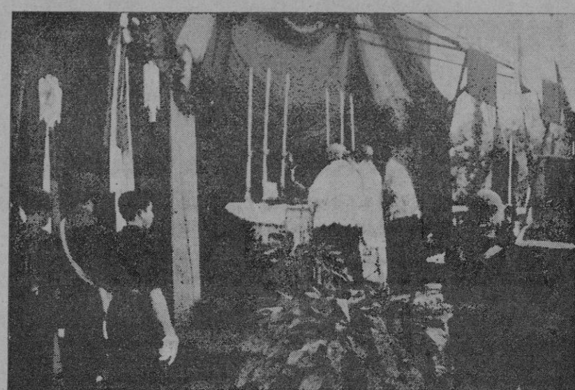
El Excmo. y Rmo. Sr. Obispo de Menorca, don Bartolomé Pascual, celebra la Misa de campaña.

Recogemos, en la adjunta información gráfica, algunos momentos de tales fiestas: muestran estas fotos la brillantez y la animación que tales actos revistieron.