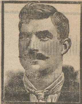
Tarrasa, Calle Media Pisco 46, 9 Marzo 1908.

Para tratar, Atrio de San Segundo núm. 6, en ésta ciudad.