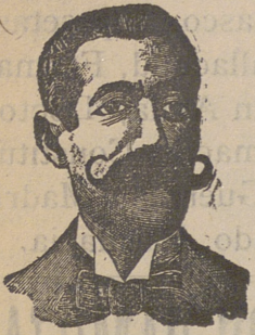
COSTANZI 284, Diputación, 284, BARCELONA