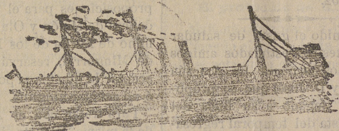
Tipo de los nuevos vapores de la Compañía.