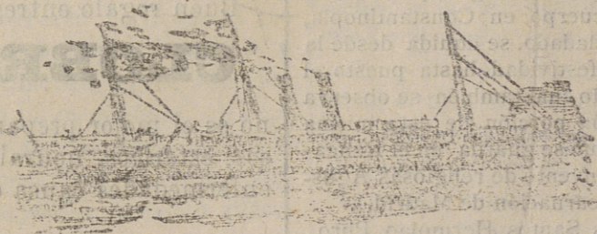
Tipo de los nuevos vapores de la Compañía.