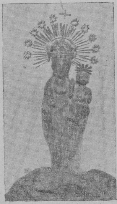
La imagen de la Virgen del Milagro, de la iglesia parroquial del arrabal de Santa Catalina, que ha sido recuperada

Relojito pulsera señora desde Cine Lírico a C. Capuchinas. Se gratificará devolución en C. Campaner, 0 12.