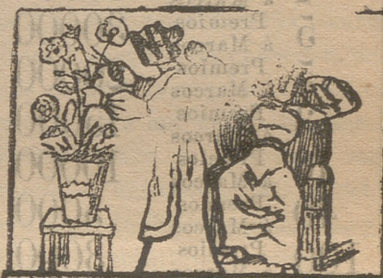
FRASE HECHA (POR VICTOR.)