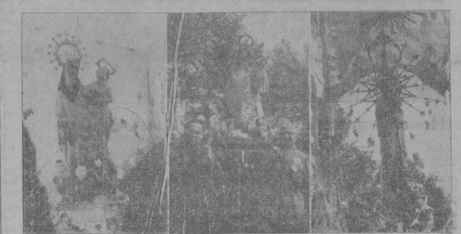
Las imágenes de la Virgen del Puig de Pollensa, San Salvador de Artá y San Salvador de Felanitx, a su llegada ayer a Palma

Compañías de Intendencia y Sanidad y Unidades de Milicias, en el andén central de la Avenida de Portugal, en formación concentrada y dan do frente al monumento antes mencionado. Compañía Mixta de Ingenieros en el arroyo de dicha Avenida, a costa izquierda de las anteriores. Fuerzas de Antiaeriana en el arroyo del costado derecho. El pelotón de motoristas y la banda de música del Regimiento de Infantería se situará en los sitios de costumbre. Llegar al banderín que se situará una vez pasada esta. d) —FORMACION.—Las unidades a pie desfilarán por compañías en línea de a tres o de cuatro, con intervalos cerrados, excepto las compañías de ametralladoras que lo harán con sus secciones en línea. Las unidades a lomo marcharán con las cargas formadas de a cuatro. Los vehículos tanto hipomóviles como automóviles desfilarán en columna doble. Las unidades marcharán separadas entre sí por una distancia de 50 metros. e) —ITINERARIO.—Via Roma. f) —PUNTO DE DISLOCACION.—Final de la Via Roma, frente al «Tro cadero». Desde este punto las Unidades marcharán hacia sus Cuarteles respectivos por el camino más corto despejando rápidamente el itinerario para evitar interrupciones en el des file.