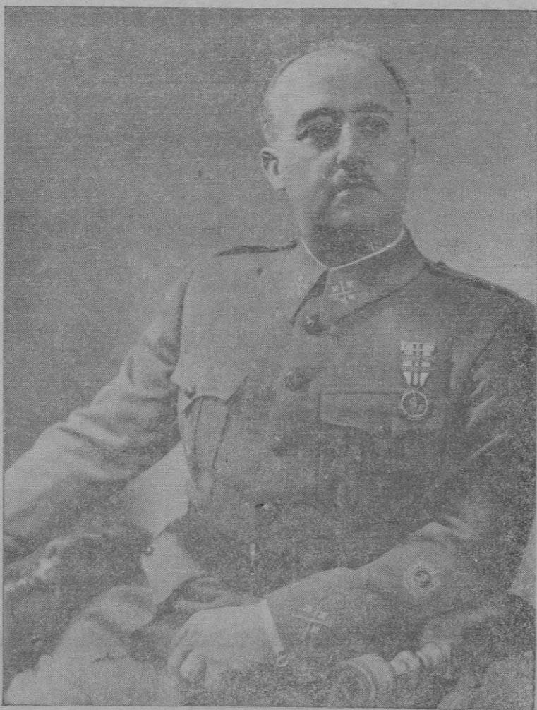
Honor y gratitud al Caudillo, a quien debe España la Victoria