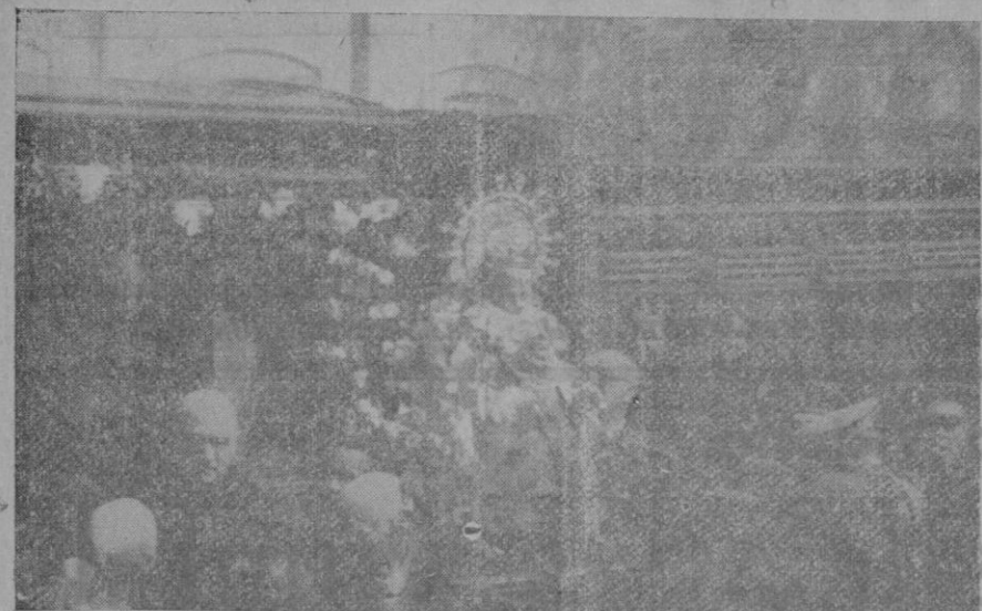
La Virgen de Bonany, al ser bajada del tren, a su llegada a esta ciudad