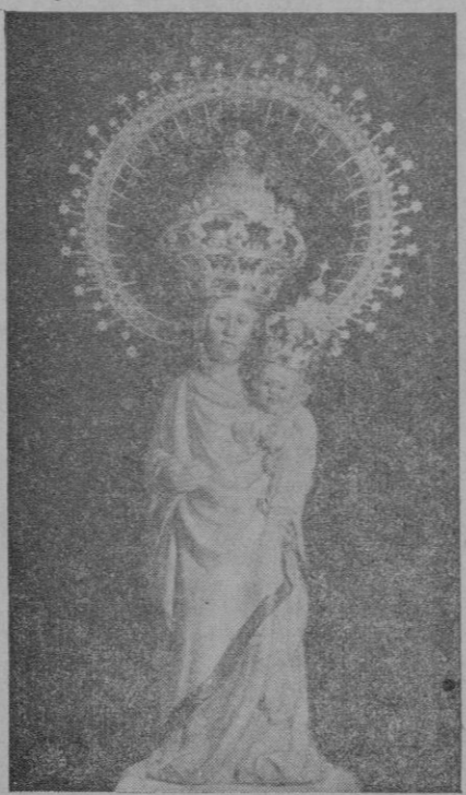
La Virgen de la Salud, de la iglesia de San Miguel de esta ciudad

En la plaza de Cort se detuvo brevemente la comitiva religiosa cuando pasaba la Virgen de Lluch, cantando