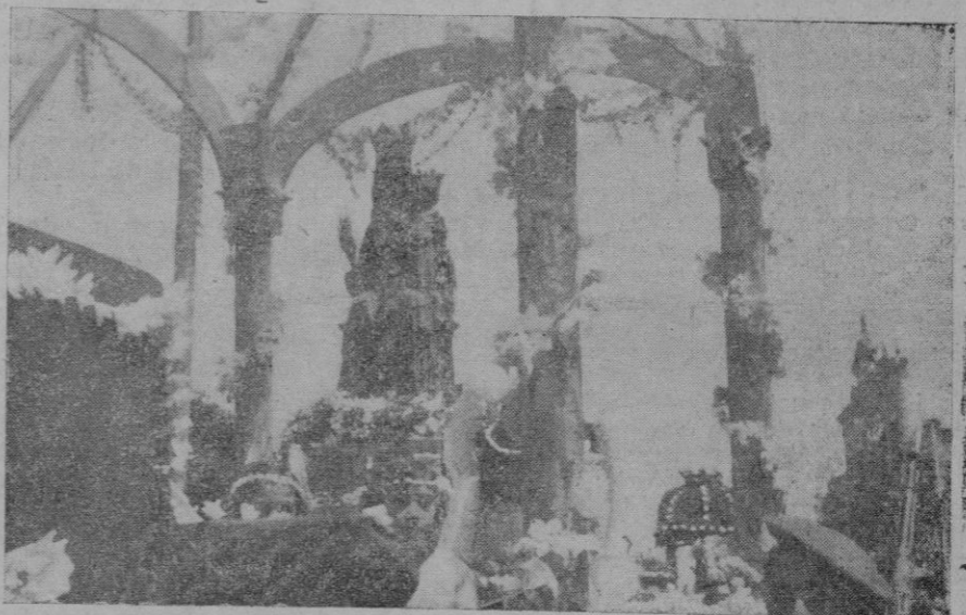
La Virgen de Santa María la Mayor, de Inca a su llegada a Palma

En las fiestas de la Victoria, nuestros artesanos muestran, de manera palpable y que no deja lugar a dudas, como supieron aprovechar el tiempo y prepararse a ser dignos de la paz, a tan alto precio ganada.