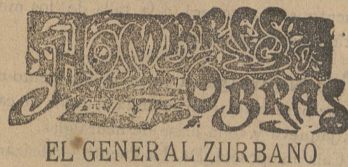
EL GENERAL ZURBANO

Kravkoff ha observado que bajo la influencia de las corrientes eléctricas se eleva la temperatura del suelo, la humedad iba aumentando y se acrecentaba la cantidad de materia fertilizante.