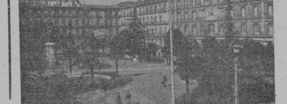
Madrid. — Un aspecto de la risueña plaza de la Villa — bello rincón del ente clasificado en segundo lugar da la magnífica Hemeroteca

El Alcalde expresó su satisfacción a los periodistas por estas recuperaciones, teniendo frases de gran elogio para la conducta del señor Machado.