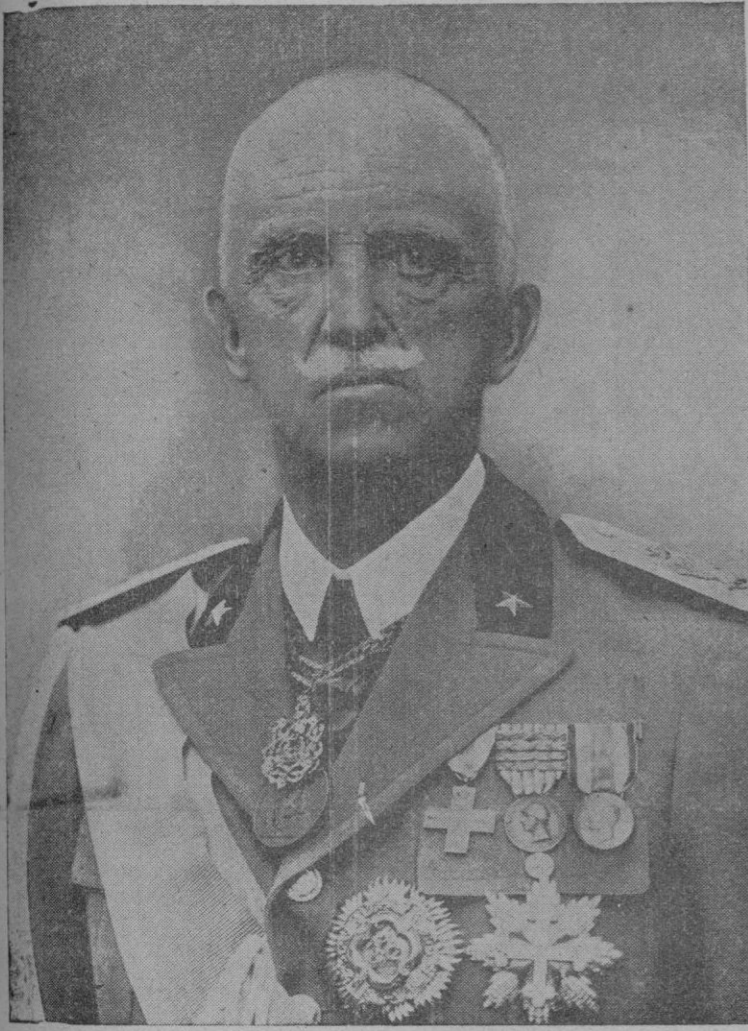
S. M. I. Víctor Manuel III, Rey Emperador de Italia

Imponente cortejo, y entre grandes aclamaciones a Italia, al Rey Emperador y al Duce, fué llevada al Conde Ciano, que se encontraba en la Embajada italiana, la declaración de la Asamblea Constituyente ofreciendo la corona de Albania al Rey Emperador Víctor Manuel