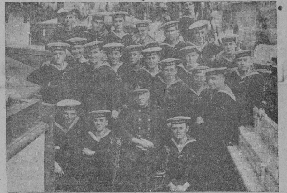
Los nuevos caballeros del mar, procedentes de la A. de F. N. de Mallorca

Pues es así, digo yo, que se hace Patria. Así estos marinos de España, calladamente, sin alharacas ni exhibiciones, en los sollados de los barcos, día tras día, modelando voluntades, esculpiendo virtudes, afirmando vocaciones, corrigiendo defectos, estirando resabios y torcidas in-