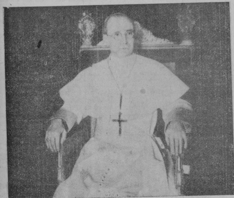
S. S. Pío XII

(Continúa al final de la primera columna de la segunda página)