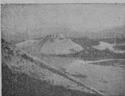
Scutari, la antigua capital del pequeño Estado albanés, está situada a orillas del lago de su nombre, en grandioso marco de montañas, al pie de elevada colina caliza que custodia las ruinas de antigua ciudadela. La llanura que la rodea es la más fértil y poblada de Albania

Hoy, martes, las agencias bancarias albanesas reanudarán sus actividades financieras y se observa que el franco albanés tendrá el mismo valor que antes.