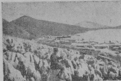
El puerto albanés de Santi-Quaranta, uno de los puntos donde desembarcaron las tropas italianas, se abre frente a Corfú, en costa angosta, rocosa y desnuda; está situado al Sur de Albania y constituye la salida natural del Epiro del Norte y de la cuenca de Koritsa

En los círculos políticos se fija una gran presión que el Gobierno inglés está ejerciendo sobre el francés para que éste adopte la política del primero frente a los acontecimientos de Albania, política a la que, por otro lado, no se pliega completamente el Gobierno de París.