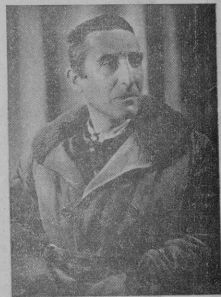
Rafael Sánchez Mazas

cho más antiguo pero a la vez mucho más moderno que el de resto de las literaturas teatrales de Europa. Nuestro Emperador es un monarca moderno, se le suele llamar el primer soberano de la Historia, pero a la vez es como César y como Carlomagno redivivos.