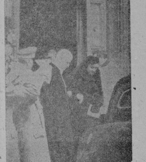
Roma. — Los Reyes Emperadores, al salir de la iglesia de San Andrés del Valle, después de los funerales por S. S. Pío XI

Continúa al final de la primera columna de la segunda página