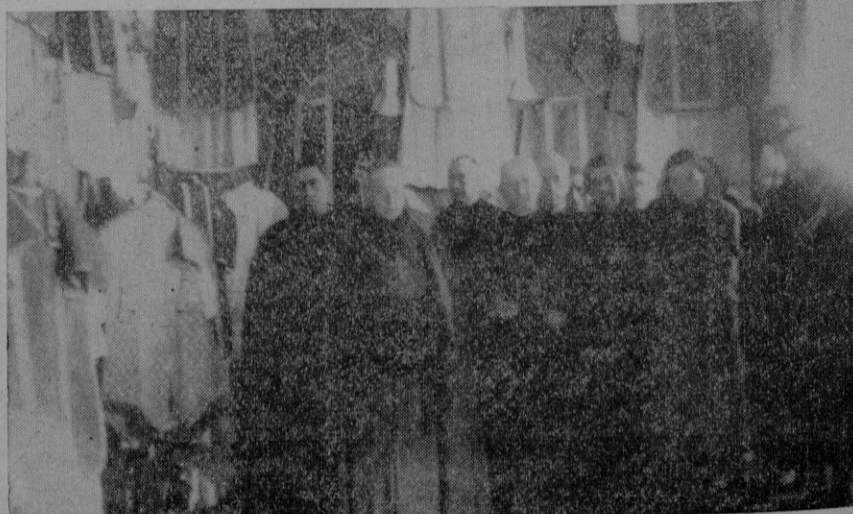
El Excmo. y Rmo. Sr. Arzobispo-Obispo, con sus acompañantes, momentos antes de proceder a la bendición de la exposición

En su nombre se expresa su origen, su objetivo y su destino; y así en su escudo tendrá una linterna de minero. Carbonia, una vez más, atestigüa y documentará la verdadera y formidable capacidad creadora y organizadora de la Italia fascista. (Aplausos).