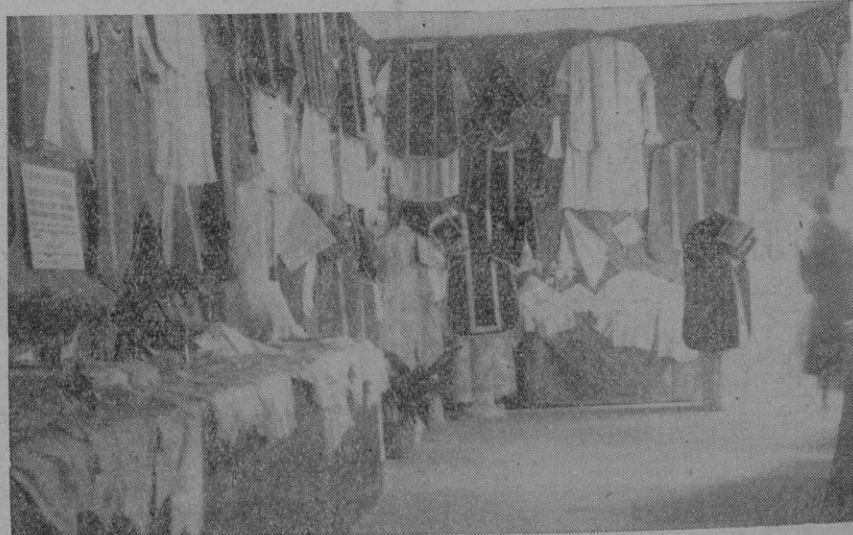
Un aspecto de la Exposición