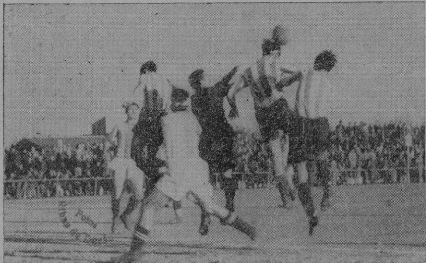
Una situación comprometida ante la meta blanquiazul

be, retornar a la España roja, por vía Francia y en el viaje de regreso llevar a cabo la evasión, con ribetes de suceso policiaco.