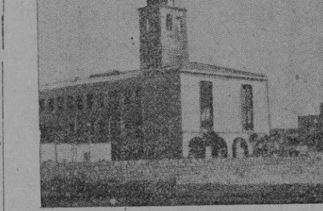
El centro urbano de la nueva ciudad italiana de Carbonia, con el campanario de la iglesia a la izquierda y la alta Casa del Fascio a la derecha

Seguidamente, Mussolini prosiguió la visita de los edificios públicos de