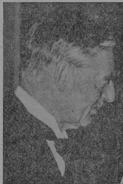
Su viaje a Roma

La historia demuestra — dijo además — que ninguna forma de gobierno es permanente, y últimamente se ha demostrado también que los gobiernos totalitarios pueden ponerse en relaciones con los democráticos y entenderse.