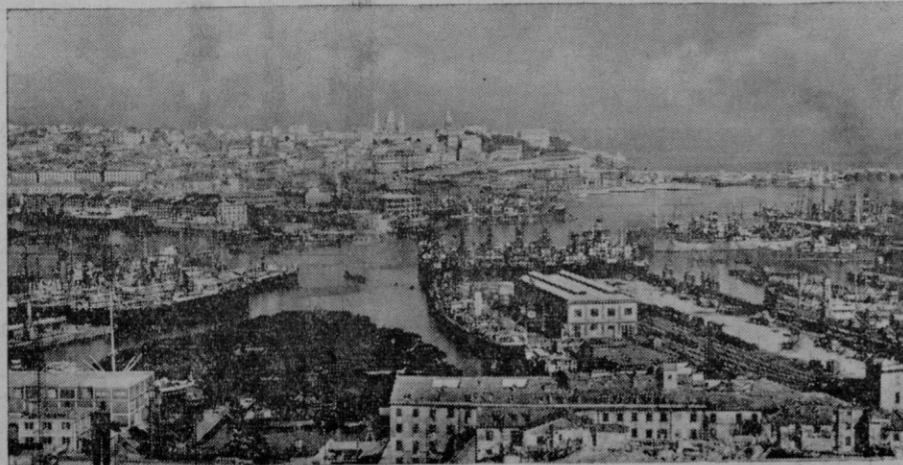
El puerto de Génova, a donde ha llegado esta mañana Mussolini.

Y muchísimos nombres podríamos citar de mujeres artistas cuya celebridad ha sido tanta como su gloria pues la mujer por el mero hecho de llamarse así, es artista desde que nace, y es inútil el empeño en demostrar lo con-