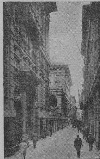
Génova. — La Vía Garibaldi, con los famosos palacios Blanco y Rojo

ciones hechas por el representante de la chusma roja catalana. Después de exponer a sus «hermanos» la gravísima situación en que se halla la República, dijo el personaje en cuestión que por muchas razones su política de ahora ha de ser la de resistir hasta agotar el último cartucho, ya que resistiendo y sólo resistiendo, tenemos posibilidad de dis-