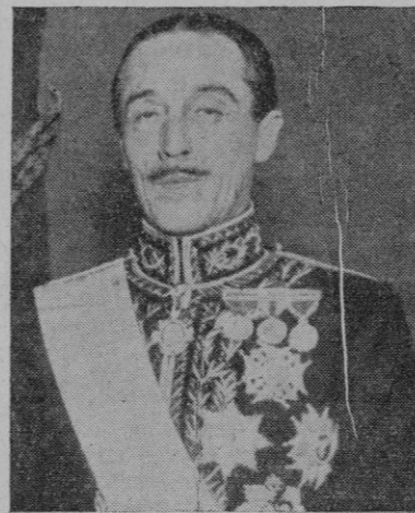
El Duque de Alba

Estos terrenos serán distribuidos a los obreros en parcelas, en cada una de las cuales se construirá una casa.