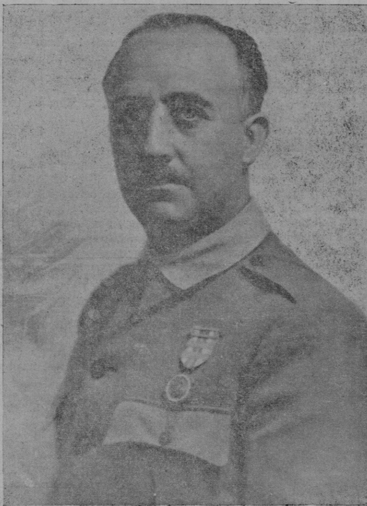
¡Franco! ¡Franco! ¡Franco!

Nosotros en esta hora tenemos ya puesta la atención en los días de la heroica reconstrucción de la Patria y de la restauración de su grandeza, que es el objetivo y fin último de la guerra. Nos esperan para ello largas jornadas en las que otra vez el sacrificio pondrá a prueba el sentido heroico de las generaciones creadoras de esta raza. El Estado abordará los