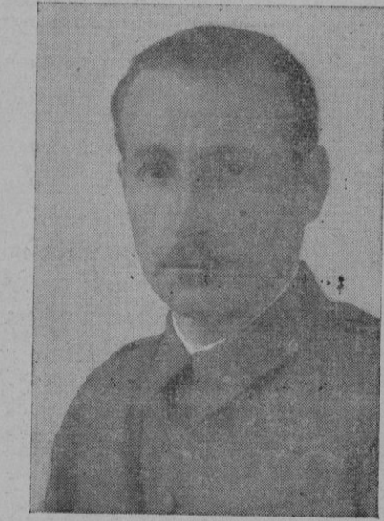
El heroico Capitán don Pedro Ramón Doix, muerto gloriosamente por Dios y por España

"La Liberté" dice, textualmente: "Se han comenzado ya las conversaciones franco-italianas; pero no se sabe aún que, cuanto antes, vaya un Embajador a Roma."