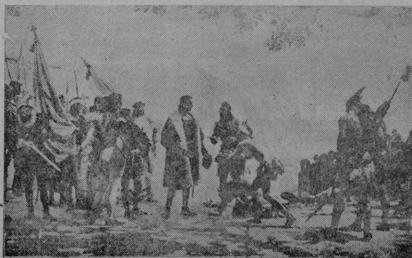
Los indios ofrecen presentes a Cristóbal Colón y a sus acompañantes, y contemplan admirados sus armas, trajes y carabelas (Cuadro de Garneio)

en muchos y duros combates y ha sido herido, para su mayor gloria, dos veces. He salido hoy, después del acto, con una satisfacción gran-