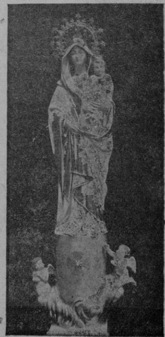
Imagen de Nuestra Señora del Pilar que acaba de ser bendecida en la iglesia de Santo Domingo de la ciudad de Inca

Palma — Fiesta de la Raza — II Año Triunfal.