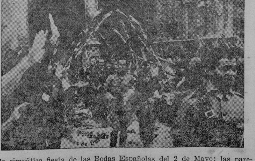
De la simpática fiesta de las Bodas Españolas del 2 de Mayo: las parejas saliendo de la Catedral después de la solemne ceremonia