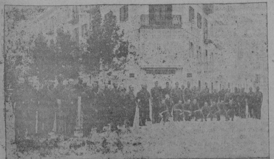
Una de las falanges que forman la centuria de "Dragones de la muerte"

Los más famosos críticos militares ingleses dicen que las disposiciones tomadas por el General Franco para el