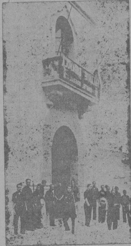
Falangistas agrupados junto al portal de su Cuartel general

Entran y salen pelotones o escuadras de falangistas, con sus cabos y sargentos, que vienen o van de guardia a algún edificio público, a algún centro ofi-