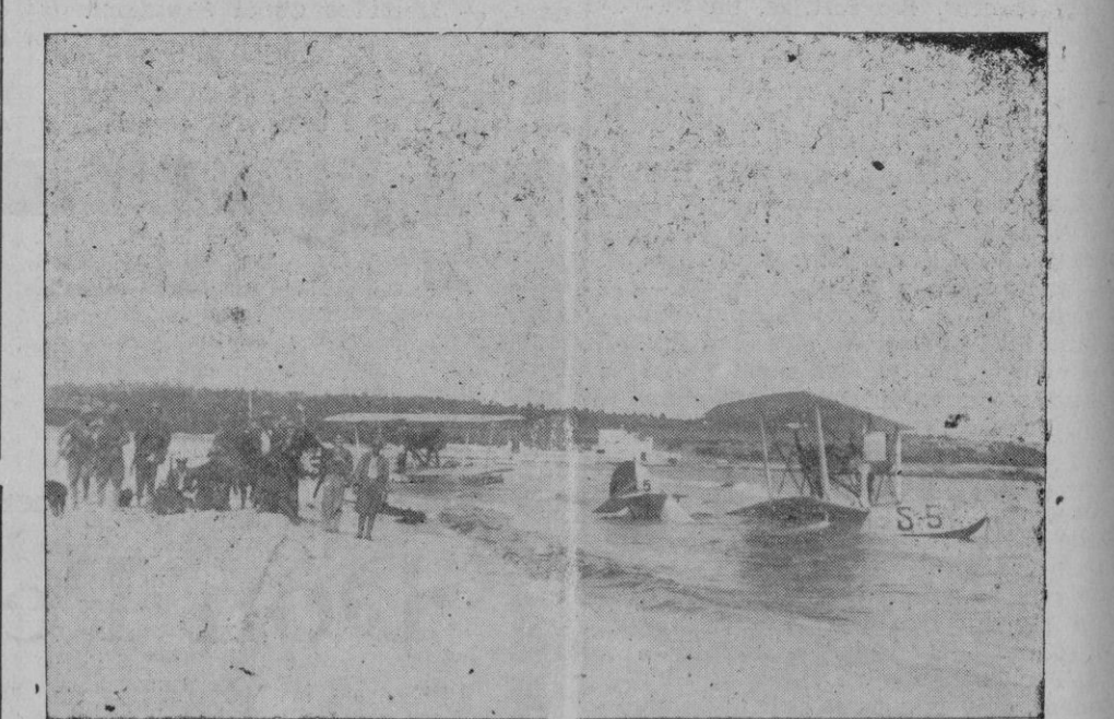
Los dos hidros capturados en las playas de Punta Amer