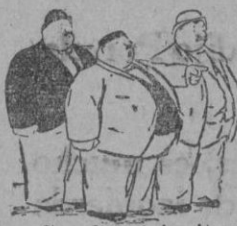
¿Se olvidó invitarles?