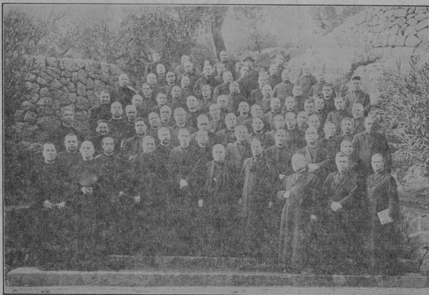
Grupo de Rdos. señores Sacerdotes que han asistido a la Asamblea Sacerdotal celebrada en el Santuario de Nuestra Señora de Lluch.

Compro Alhajas de oro y plata Dentaduras usadas Monedas antiguas de oro, plata y cobre: I. MIRO Sindicato, 4 (al lado de la chiscolatería Bordov).