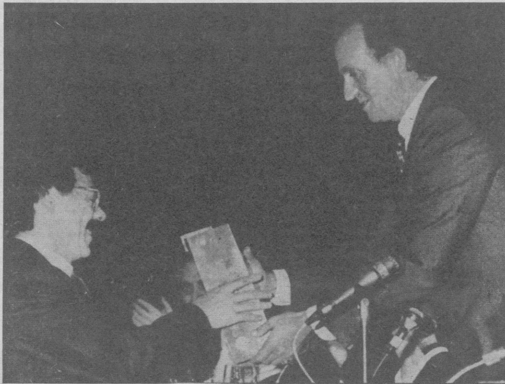
El Rey Juan Carlos, en el momento de entrega del premio a Alberto Corazón.

Madrid.--El Rey Juan Carlos entregó ayer los Premios Nacionales de Diseño Industrial, en su tercera edición, que recibieron la empresa BD, Alberto Corazón y Santiago Miranda, en un acto celebrado en el Ministerio de Industria.