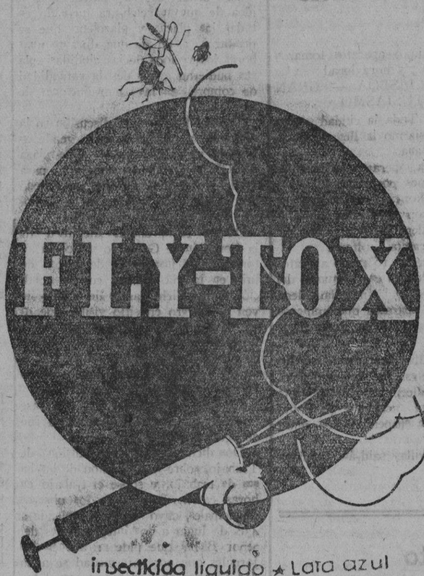
insecticida líquido * Lata azul

De venta: Librería La Esperanza — Sindicato, 98