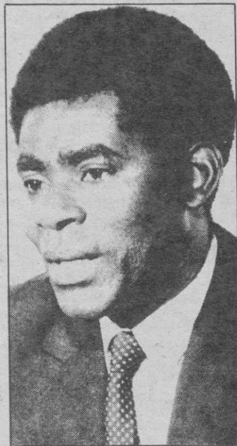
Teodoro Obiang Nguema.

Acompañan al presidente en su viaje, además de su esposa,