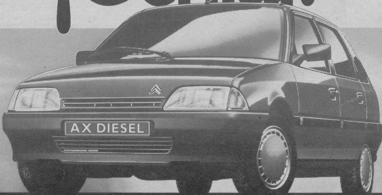
EL AX DIESEL DEJA A SU COMPETENCIA EN CUADRO.