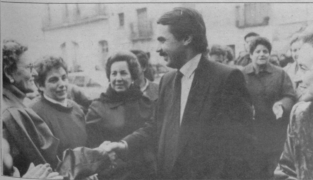
José M. a Aznar saludó a varias mujeres a su llegada a Nava de la Asunción.

En un ambiente distendido desmitificó la imagen inaccesible de un presidente regional