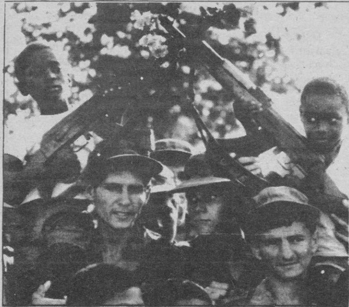
En la foto, algunos soldados muestran su alegría al salir de Angola.

La Habana.—Los primeros 450 soldados y oficiales cubanos que regresan de Angola tras la firma de los acuerdos de paz de Africa Austral, fueron recibidos en La Habana por Raúl Castro, ministro de las Fuerzas Armadas Revolucionarias (FAP), miembros del Partido, del Gobierno y familiares.