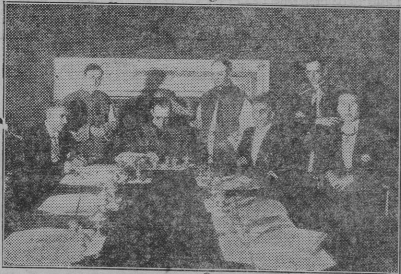
Ciudad del Vaticano. — La firma del Concordato entre el Vaticano y el Reich por el cardenal Pacelli y el vicescanciller Von Papen.

Los trabajos de excavación continúan, pues en los centros arqueológicos se esperan aún valiosos descubrimientos.