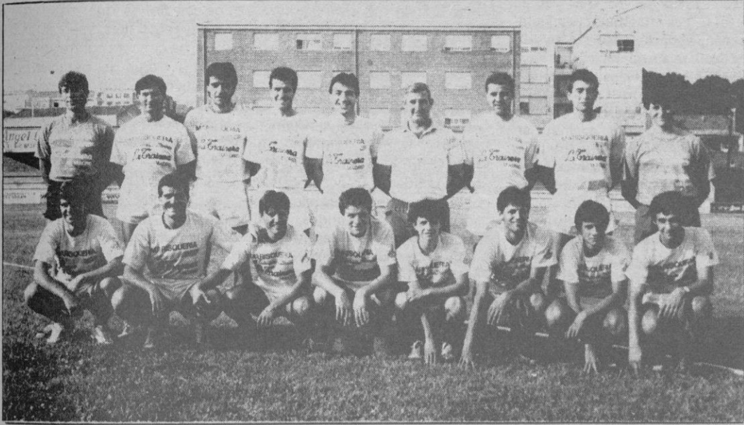
El Astorga, sin entrenador

Los socios también habrán de abonar su entrada