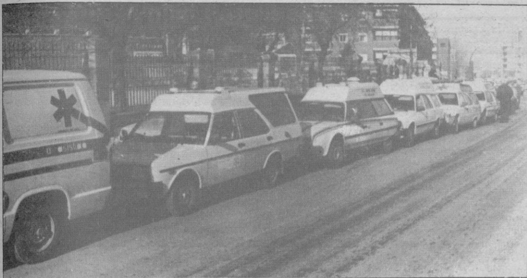
Las ambulancias comenzaron a concentrarse sobre las diez de esta mañana.

Ambulancias de toda España se han solidarizado con la empresa «Ambulancias Segovianas S.A.»—antes «Ambulancias Alvarez»—cuyos trabajadores tendrán que ir al paro si no se llega a un compromiso con el Insalud. A la hora de cerrar esta edición, las conversaciones que comenzaron ayer alrededor de la una de la tarde, no habían tenido resultados positivos.