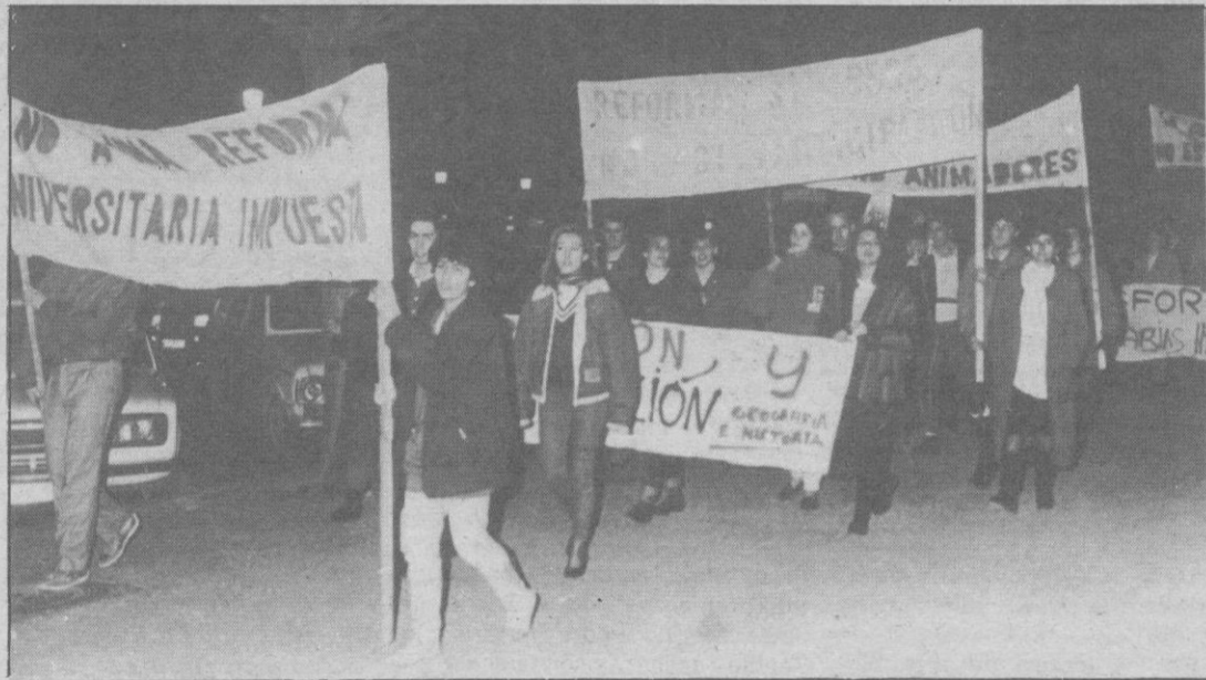
Un grupo de jóvenes, entre 50 y 100, asistieron ayer por la tarde en la Plaza Mayor en una con-

centración exigiendo al Ministerio de Educación y Ciencia la participación de alumnos en el nue-