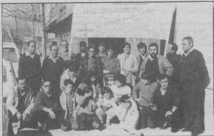
Reunión de trabajadores de la empresa Ambulancias Segovianas.

Miembros de la Asociación calculaban que se trasladarían a Segovia unos ciento cincuenta vehículos «basándonos en las muchas llamadas de solidaridad que hemos recibido».