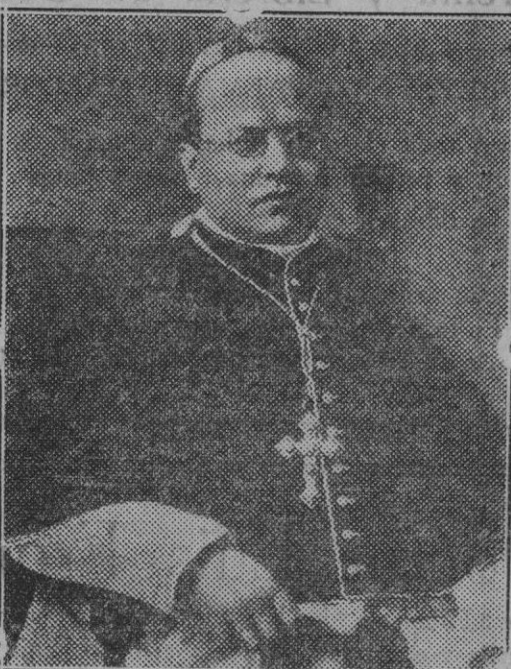
Berlin. — Monseñor Tommaso Pio Boggiano, proclamado cardenal por S. S. Pío XI, para cubrir la vacante del difunto purpurado monseñor Frühwirths.