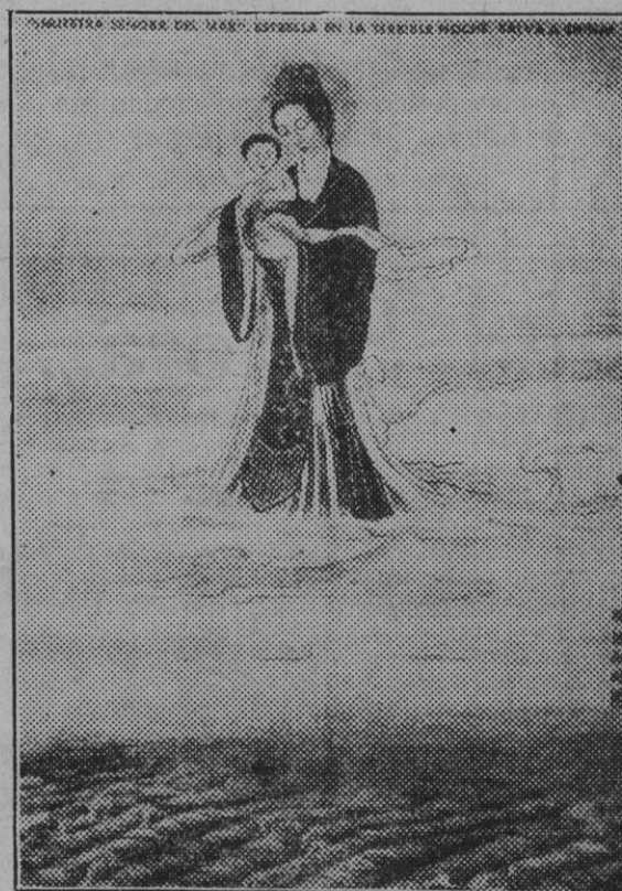
Uno de los últimos lienzos pintados por Tcheng, ilustre artista chino, recientemente convertido al catolicismo.

La noticia ha sido cursada de Johannesburgo.