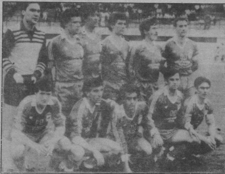
El Avila, también perjudicado