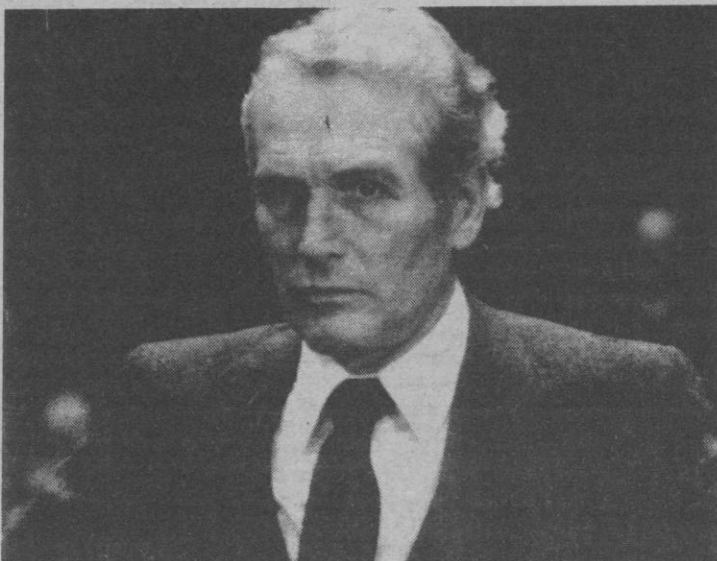
La Academia de Hollywood entregó la pasada madrugada un Oscar honorífico a Paul Newman por toda su carrera. A pesar de haber sido nominado en cinco ocasiones, entre ellas por «Veredicto final», película a la que corresponde la fotografía, el actor nunca recibió la estatuilla. Con sesenta y un años, Newman, que fue la gran estrella en la fiesta anual del cine, recibió su merecido homenaje aún en la cumbre de su trabajo artístico después de haber interpretado más de medio centenar de películas.