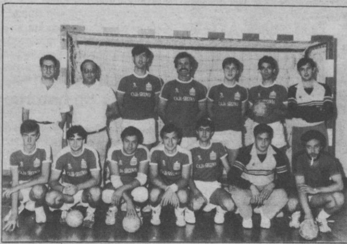
El Caja, decide

No es que la decisión sea «salomónica», más bien es al contrario, oséase: que no se entiende. Y es que el Comité de la Federación Española de Balonmano ha decidido que el encuentro Caja Segovia-Gromber se juegue el día 30 de marzo (próximo domingo), a las 12 horas. Normalmente todos los partidos que se suspenden a lo largo de la competición han de jugarse antes de acabar la Liga oficialmente. Pero dando una muestra más del poco interés que se tiene por el balonmano de Segunda, se tomó la