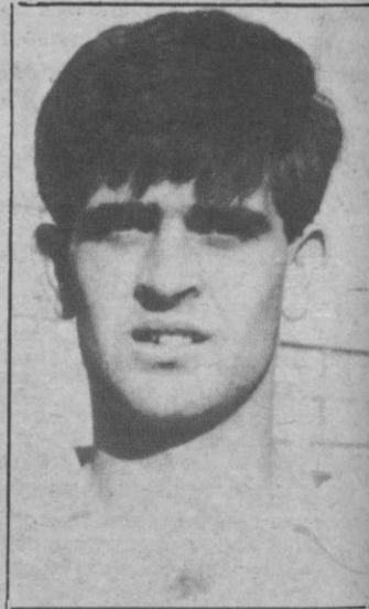
Rúper, se «quedó»