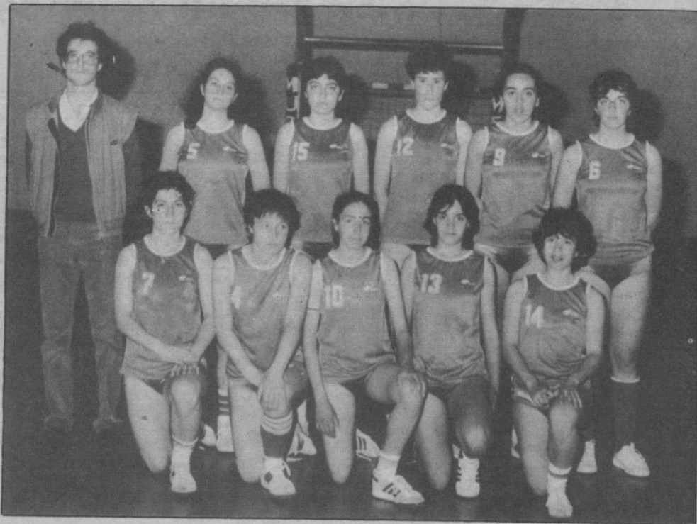
Jesuitinas: «Ayer», juveniles; hoy, junior

En Valladolid se van a jugar las fases finales del Campeonato Regional de baloncesto, paso definitivo para acudir al Campeonato de España.