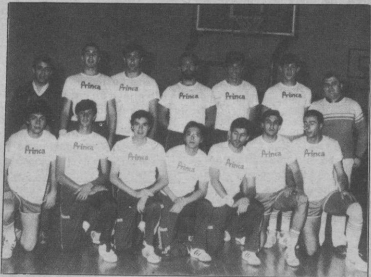
Frinca: No pudo