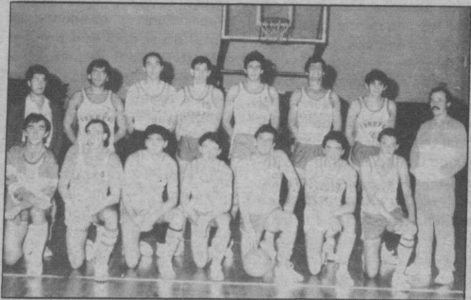
Europol Imperio fue superior

Alrededor de trescientos espectadores se dieron cita en el polideportivo municipal «Angel Nieto», de Zamora para presenciar el partido entre el conjunto Frinca, de esta capital y el Europol Imperio. En esta ocasión lograron ver un buen encuentro.