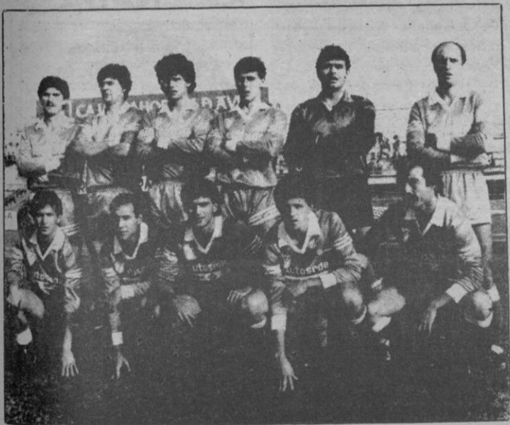
El Móstoles recuperó

moda en la primera plaza y con esperanzas de quedar campeón. Méritos está haciendo por ello.