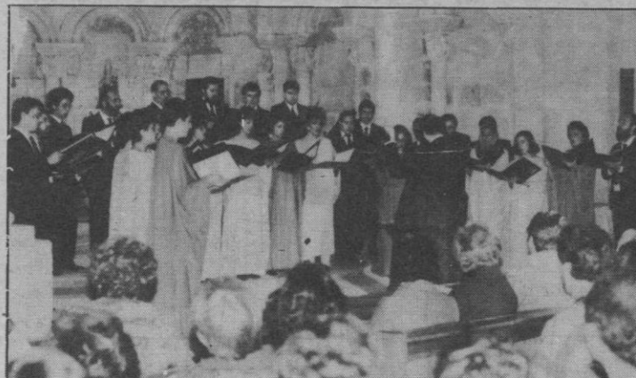
La Coral Cantiga, de Madrid

Sus voces, escogidas del ambiente universitario de Madrid, interpretaron con especial acierto el último bloque aludido, obras que incluirán en una gra-