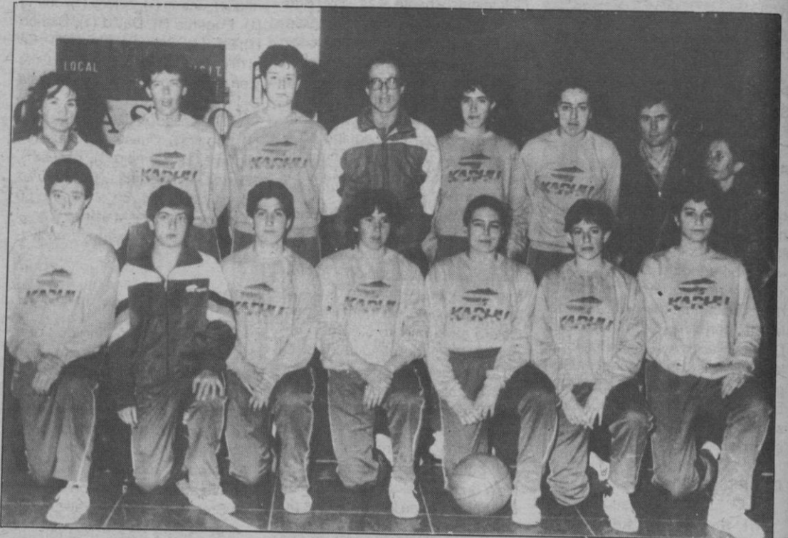
Jesuitinas: Todo un señor equipo

Kaixo, al vencer a Juven, campeón del grupo con los mismos puntos que las segovianas