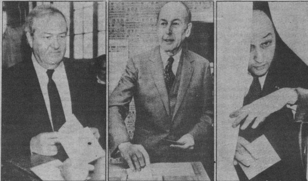
De izquierda a derecha, Jean-Marie Le Pen, Valéry Giscard d'Estaing y Laurent Fabius, en el momento de votar ayer

Es posible que la coalición de derecha tenga que contar con los votos de diputados independientes