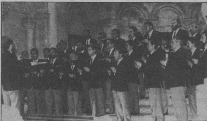
La Coral Araba, de Vitoria

Los pasados sábado y domingo continuaron, en la iglesia de San Millán, las actuaciones programadas en la VI Muestra de Masas Corales que organiza la coral segoviana Agora.