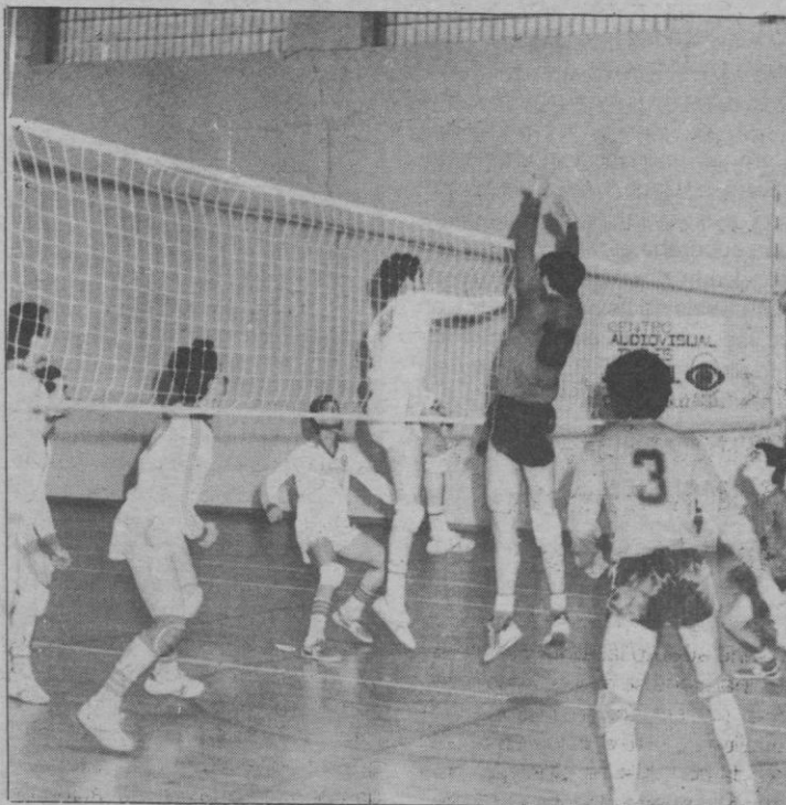
Otra buena victoria segoviana

Ganó el Alcázar-Ertoil el sábado pasado en el E. Teodosio al Instituto Zorrilla de Valladolid. El pabellón presentaba un gran ambiente con presencia de numerosos seguidores pucelanos. El resultado final fue de 3-1 con parciales de 9-15, 15-9, 15-9 y 15-10 en 29, 29, 22, 24 minutos respectivamente.