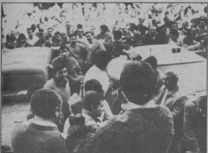
VIGO.— Trabajadores de ASCON celebraron ayer una manifestación dirigiéndose a las oficinas de los Fondos de Promoción de Empleo donde se enfrentaron con varios funcionarios de la misma, posteriormente culminaron su movilización frente a la sede del PSOE con una asamblea, momento que recoge la fotografía.

A ello contribuye, añadió, la alta proporción que representa el turismo organizado, ya que los operadores turísticos ofrecen los paquetes más baratos en temporada baja, con lo que atraen a otro tipo de visitantes. —Efe