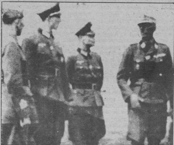
KURT WALDHEIM PUDO SER UN NAZI

Las investigaciones para recuperar los bienes y efectivos del expresidente y su grupo se centrarán en Estados Unidos, América Latina, Suiza y Gran Bretaña, según reveló el exsenador.—Efe