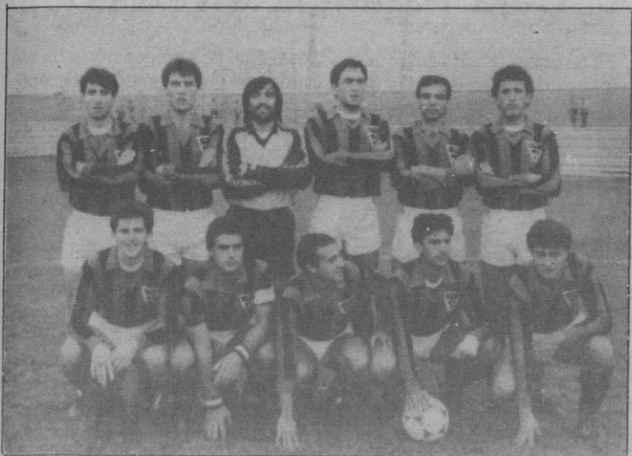
Es el Azuqueca. El domingo juega frente a la G. Segoviana

La G. Segoviana perdió su noveno positivo en casa