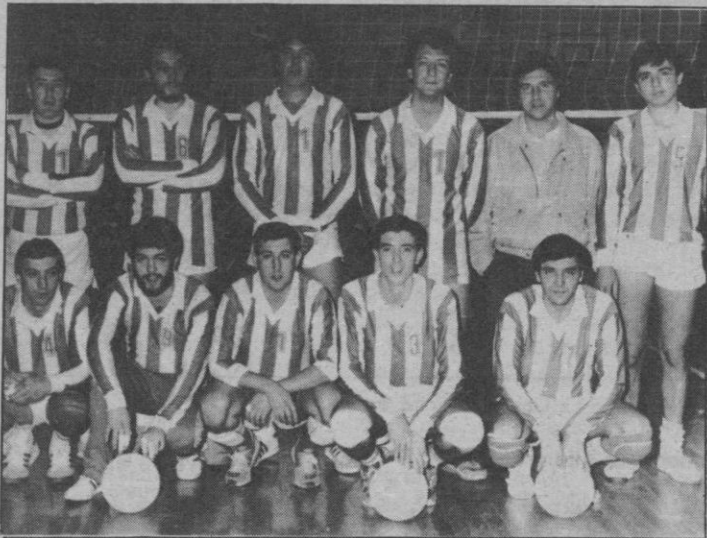
Barco de Avila: Sólo entusiasmo

Tras un largo viaje hasta la localidad salmantina de Béjar, lugar en la que juega sus partidos el equipo de Barco de Avila, al no disponer de cancha en su residencia, consiguieron una victoria más en esta competición que les está siendo mucho