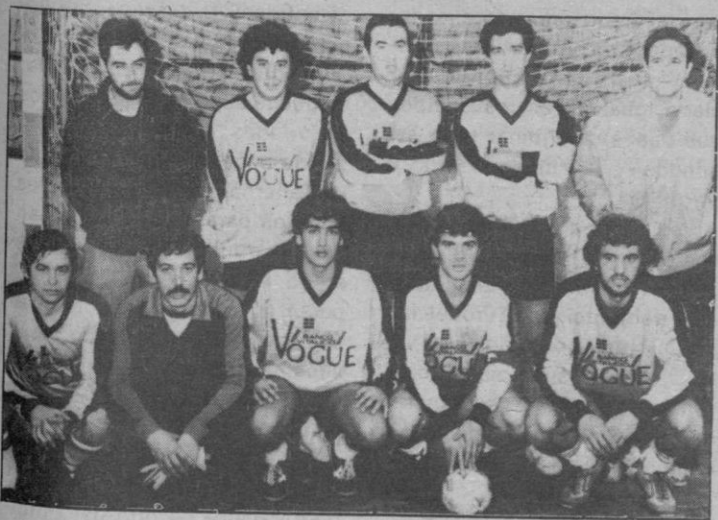
Vogue: Fuerte comienzo

consigue parar el Annisa en esta fase final. Sabido es que si este equipo cuenta con toda su plantilla de jugadores tiene grandes posibilidades de proclamarse líder. Al tiempo. El Quintanar era equipo de respeto y ahí está el marcador.