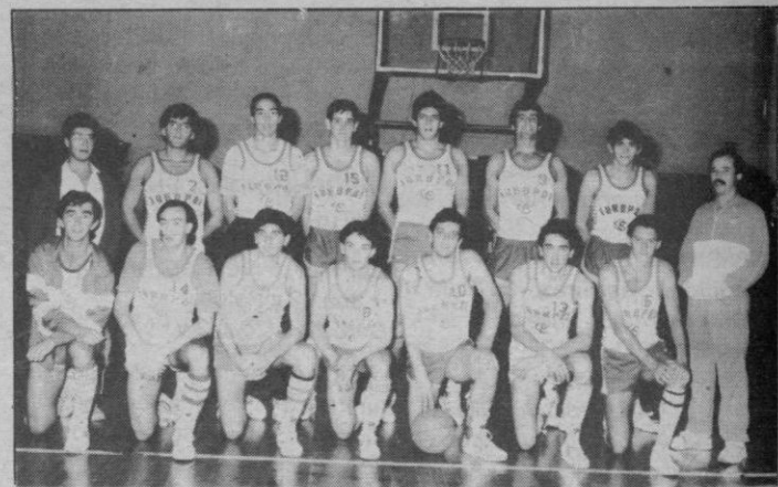
Perdieron, pero no debieron

Puede que se hable demasiado de los árbitros. Puede que, incluso, se «carguen las tintas» en momentos determinados, pero el tradicionalmente denominado «problema arbitral» existe. Y se ve más cuando hay cierta igualdad en los equipos que puede determinar —en segundos—, la victoria de uno u otro.