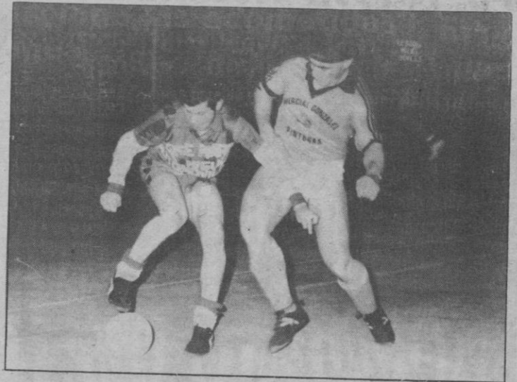
La Liga Provincial, en buen momento

Disney-Annisa, a las 10 Bar Flor-Lieutenant, a las 11