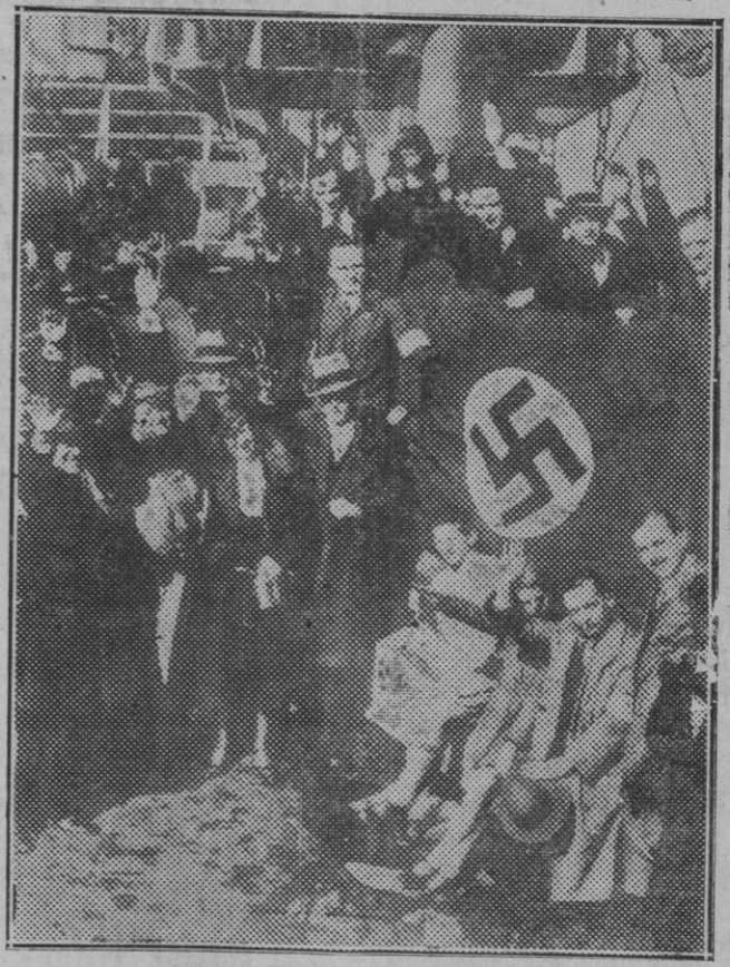
Barcelona. — Grupo de "nazis" cantando el himno alemán en la cubierta del "Halle" ante la cruz esvástica.

En día tan memorable, CORREO DE MALLORCA se complace en expresar al venerable religioso su respetuosa y cordial felicitación.