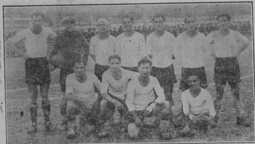
Equipo del Constancia, F. B. C., de Inca, que ayer en el campo de Buenos Aires, conquistó el codiciado galardón de Campeón de Baleares.

Biblioteca Agrícola. Manuales prácticos de Agricultura. De venta: Librería "La Esperanza" Sindicato, 98.