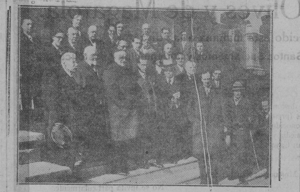
Barcelona. — El comité ejecutivo de la Alianza Cooperativa Internacional al salir de visitar la Quinta de Sa luda "La Alianza".