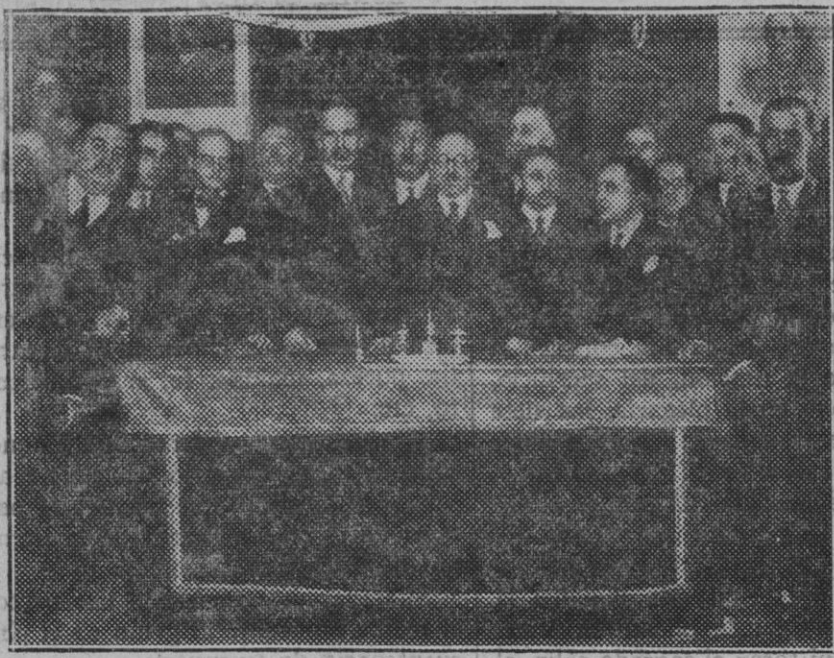
Madrid. — Sesión inaugural de la Asamblea Patronal Agrícola. La mesa presidencial con algunos de los asistentes al acto.

para una buena fotografía. Trabajos especiales en ampliaciones. PALACIO, 10 — TEL. 1 9 2 5 — PALMA