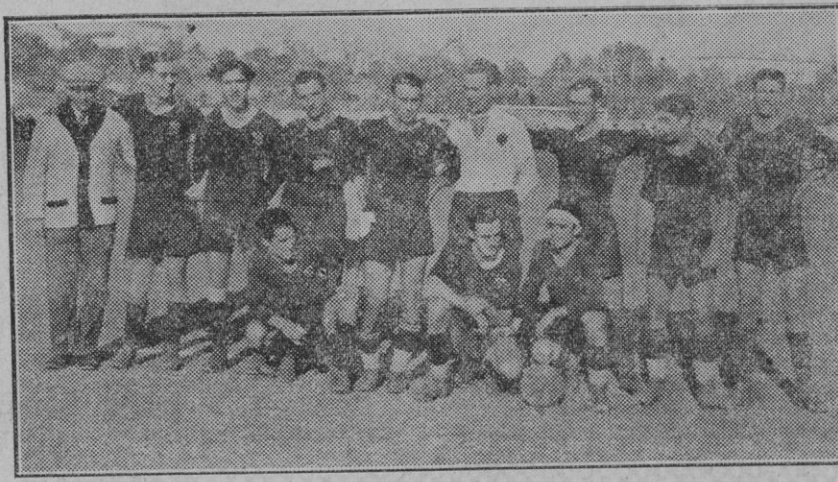
Equipo del C. D. Mallorca que ayer luchó con el equipo Constancia F. B. C. disputándose el Campeonato de Baleares.