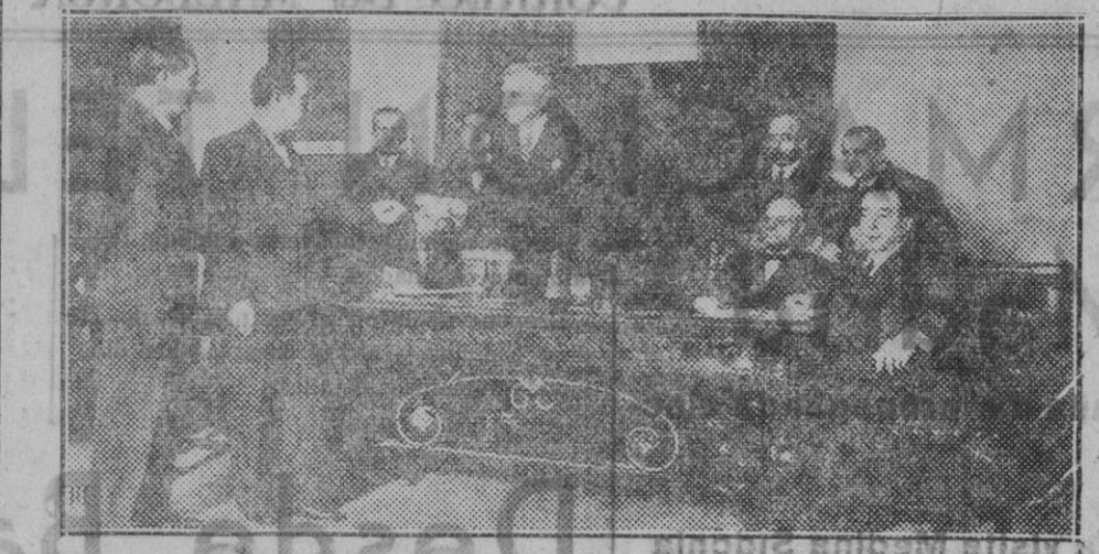
Madrid. — En el Colegio de Médicos. Reparto de premios del Curso de Odontología.

Fomento del espíritu cristiano que anima y vivifica el amor conyugal.