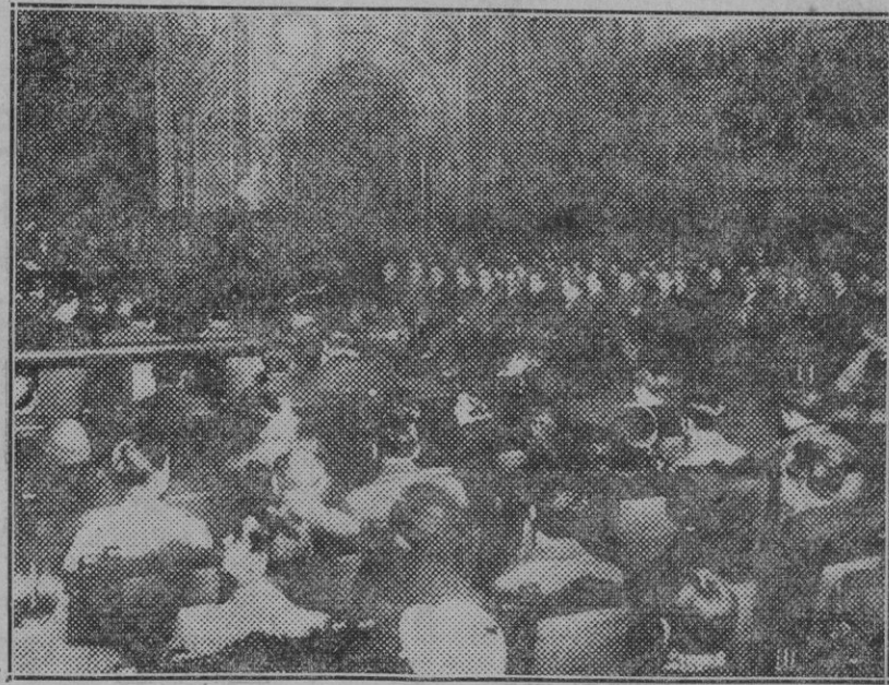
Barcelona. — Acto inaugural del I Congreso de Peritos y Técnicos Industriales de Cataluña celebrado en el Paraninfo de la Universidad.