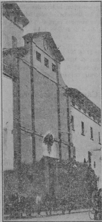
Iglesia de San Antonio de Viana ante la cual se ha celebrado hoy la tradicional bendición de caballerías.