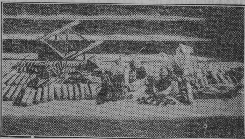
Salient. — Pistolas, bombas, municiones y cartuchos de dinamita que se encontraron en el local del Sindicato.