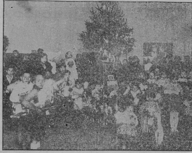
Barcelona. — Reparto de juguetes a los niños pobres en el Hospital de la Cruz Roja.

Jurídicamente se declaran constitucionales y legalistas. Por último, dice que son demócratas política y socialmente, porque cree que el pueblo no debe ser el sujeto del poder, pero sí su principal y casi único objeto. Termina el escrito haciendo un llamamiento a todos cuantos deseen contribuir a salvar lo que aún quede de la riqueza, de las energías y del tesoro espiritual de España.