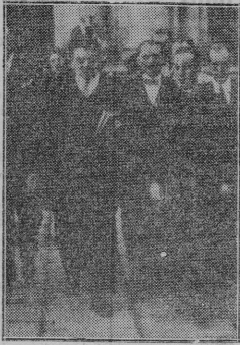
El señor Herriot en el Patio de los Reyes del Monasterio de El Escorial.

el Director general de Tele-comunicación obsequiará a las autoridades locales, acto que se celebrará en el Hotel Mediterraneo.