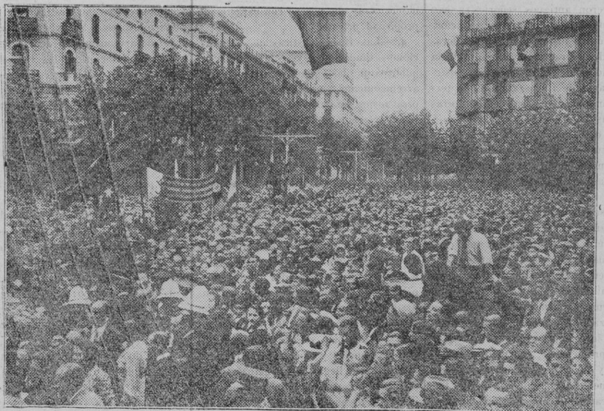
Barcelona. — Homenaje al "Conceller en cap" Rafael de Casanova, acto que este año ha revestido excepcional importancia con motivo de la aprobación del Estatuto.

"Ahora que ya tenemos aprobado un Estatuto de autonomía — digno de ser apreciado, aun cuando no sea el que hubiéramos querido —, es preciso que Ca-