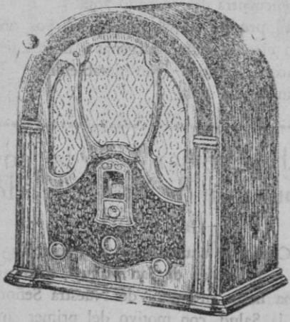
MODELO W R - 17