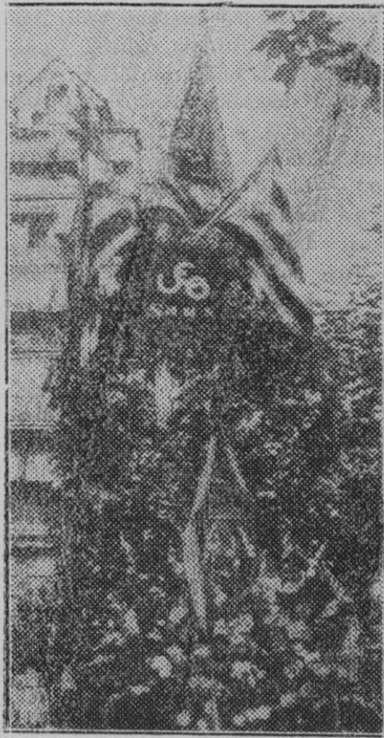
Barcelona. — Homenaje a los mártires de 1714. La estatua de Rafael Casanova materialmente cubierta de coronas y ramos de flores.

Cataluña exprese su agradecimiento a los no catalanes que han ayudado a que se le hiciera justicia.