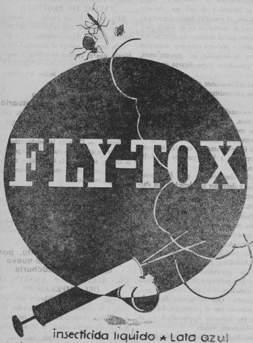
insecticida liquido * Lata azul