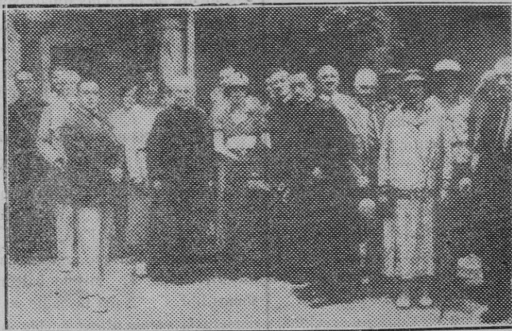
Córdoba. — Profesores franceses católicos que en viaje de estudios permanecerán varios días, en esta capital para visitar los monumentos históricos.

Gran liquidación de artículos para vestidos, abrigos y mantas de lana.