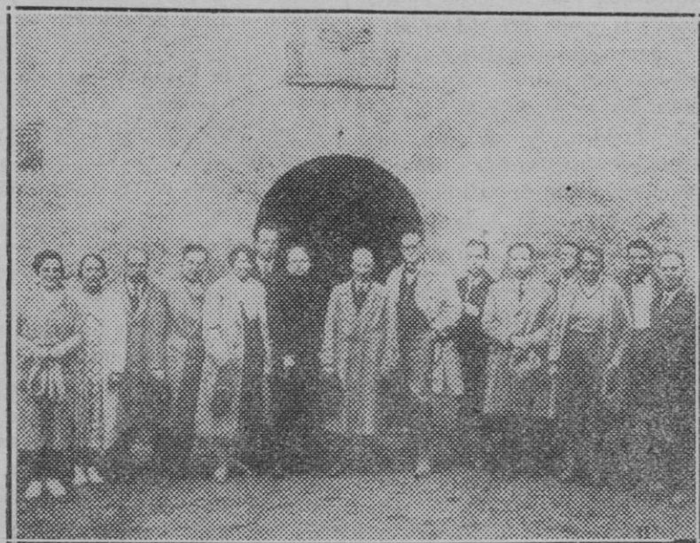
Andorra. — Miembros de la Institución Catalana de Historia Natural al salir de la reunión celebrada en la "Casa de la Vall".