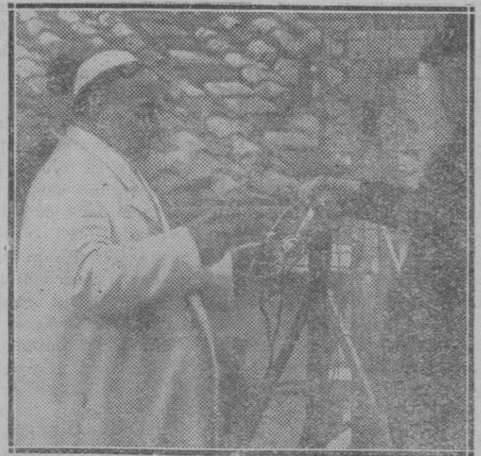
Marconi realiza una nueva instalación de radio en el Vaticano. — El gran inventor Marconi ha dirigido una instalación radiofónica de onda corta en la Sede Pontificia para comunicación del Vaticano con el palacio de Castelgandolfo. He aquí a Su Santidad el Papa recibiendo los auriculares de manos del insigne hombre de ciencia, para la primera audición.