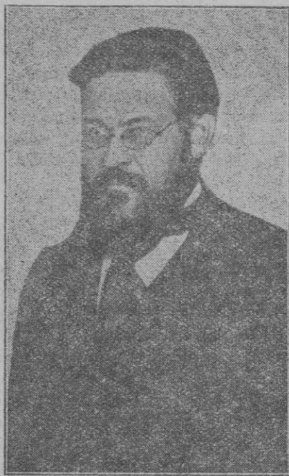
M. Albert Thomas, Director de la Oficina Internacional del Trabajo en Ginebra, que falleció ayer, domingo, repentinamente, en París.