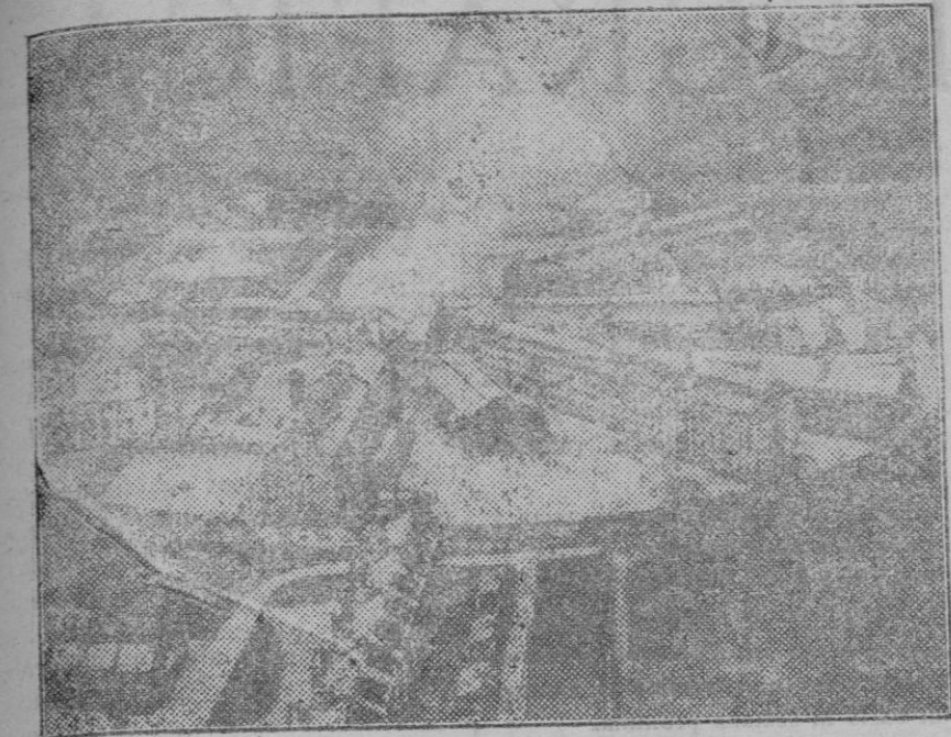
El plante del penal de Dartmoor en Inglaterra: Vista aérea del presidio de Dartmoor, cuyos reclusos fraguaron un plante para evadirse, luchando con sus guardianes e incendiando la parte central de la cárcel.