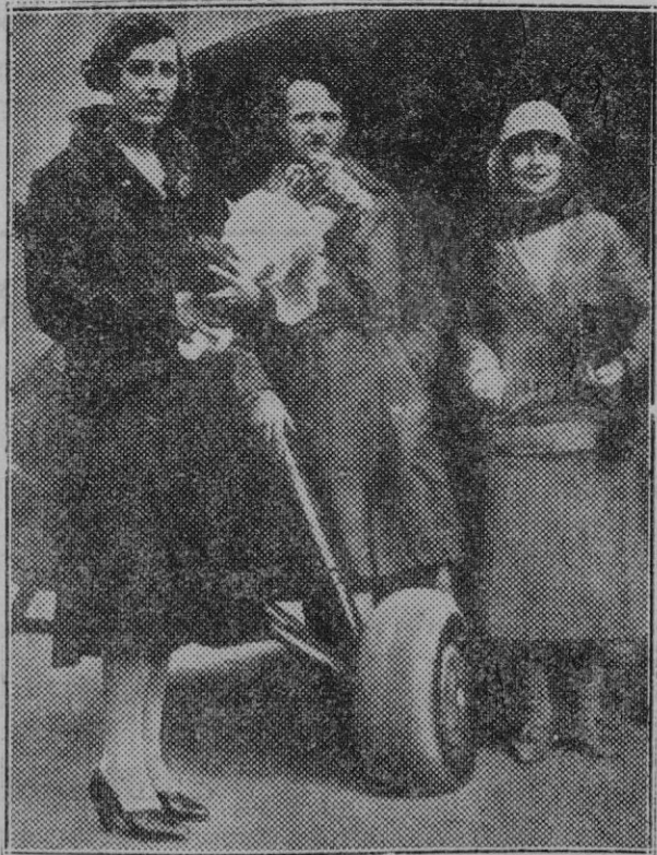
Mis Amy Johnson, la famosa avia dora inglesa, a su llegada al aeródromo de Croydon (Londres), de retorno de su vuelo Inglaterra-Japón, cuyo trayecto cubrió, en su viaje de vuelta, en nueve días.