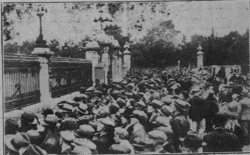
Londres. — El público estacionado en espera de la salida de los jefes de los partidos políticos ingleses, llamados a consulta por el Rey Jorge V.

Se deslizó la carrera sin incidentes dignos de mención pero muy reñida hasta la vuelta 29 en la que ya Flaquer, al ganar el sprint número cinco empezó a destacarse sobre todos sus adversarios doblando una vuelta a los corredores Villalonga, Crespo, Taberner, Santandreu y